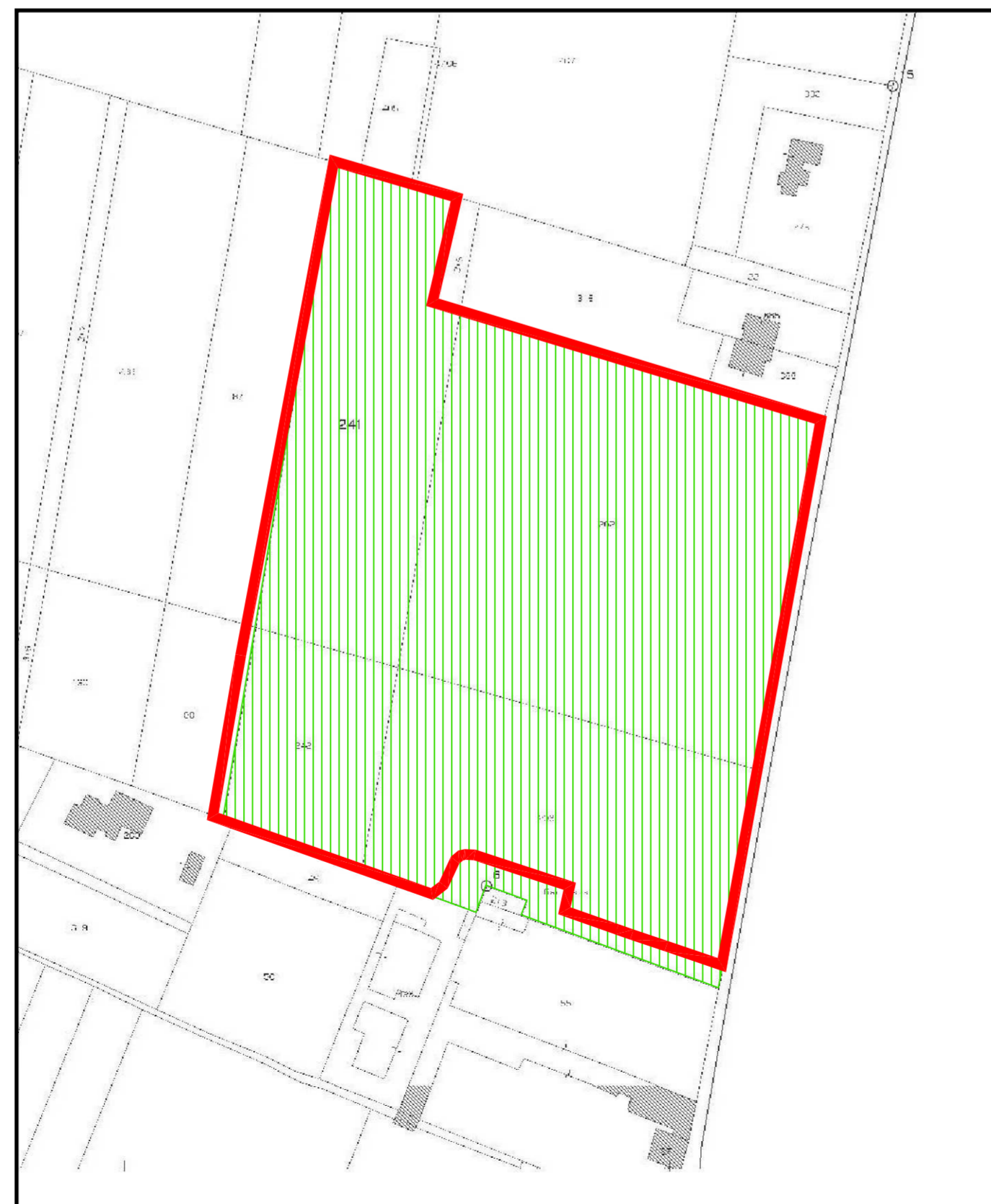
ESTRATTO DI MAPPA CATASTALE - scala 1/2000